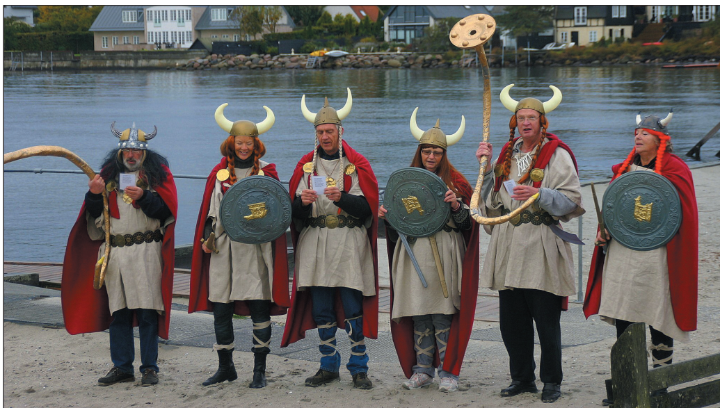
Lurendrejerne - vores unikke stolthed - er klar til at kaste musikalsk glans over Havnefestivalen.