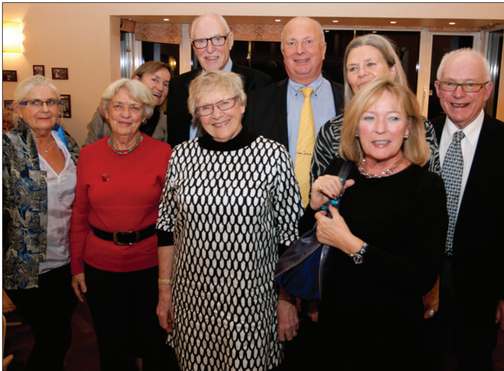
Et tungt åg hviler på disse ni skuldre: Bordet vandt quizzen og får dermed fornøjelsen af at levere quizzen til næste års Solhvervsfest, som foregår torsdag 3. december i Rungsted Golf Klub.