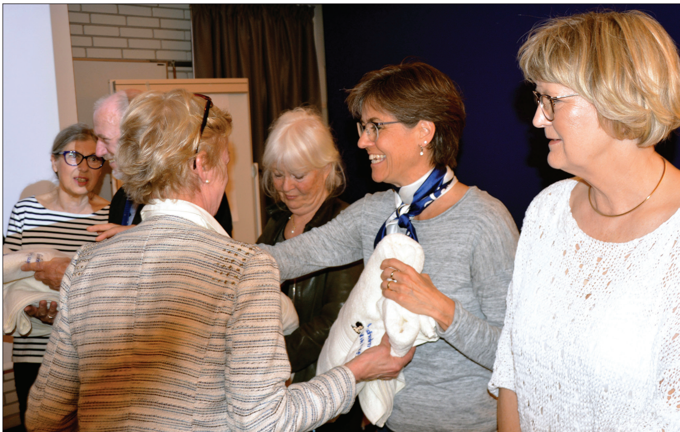
Her er det 10 års-klædet som deles ud på Generalforsamlingen 2016.