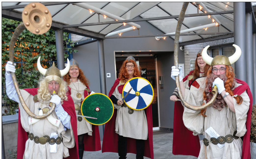
Generalforsamlingen 2016: Lurendrejerne tog imod foran Hotel Marina.

Generalforsamling torsdag 27. april 2017 kl. 20.00 på Rungstedgaard, Rungsted Strandvej 107. Dagsorden for Generalforsamlingen er ifølge vedtægterne: