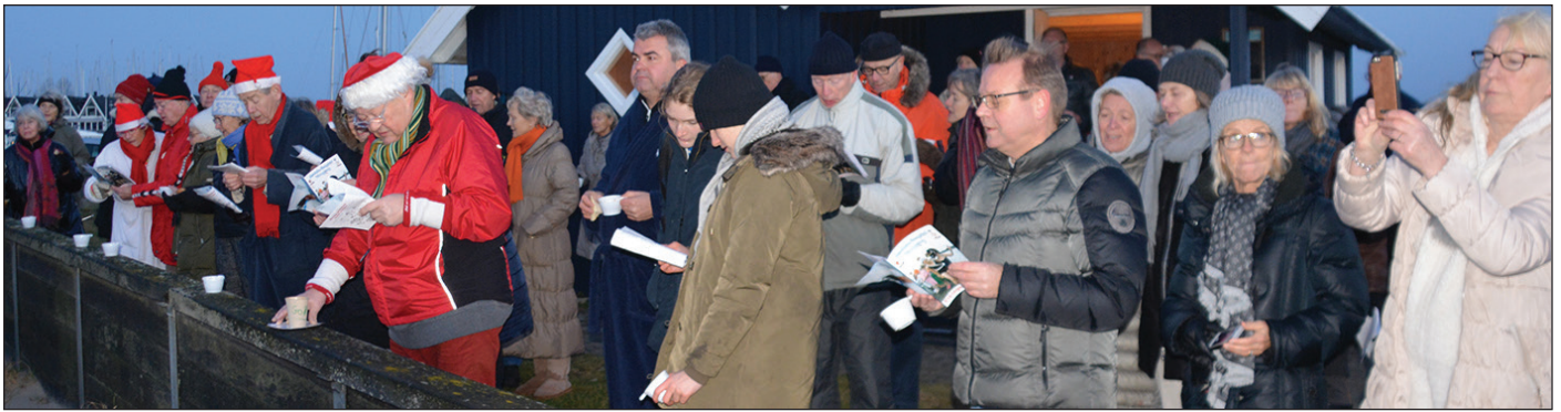
Nissehuerne var fundet frem sammen med sanghæfterne til Julebadningen 2016 - mød op søndag 24. december klokken 8.15.