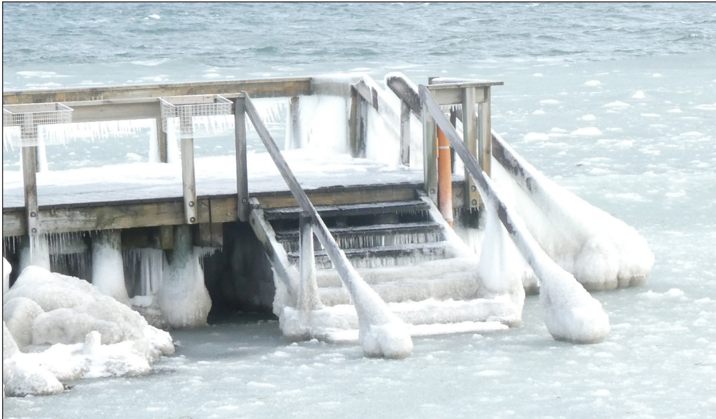
Isen har godt tag i trapperne - så pas godt på dig selv og andre, når du bader.