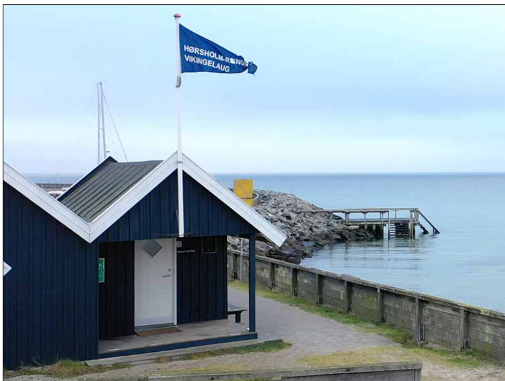
Mellem Vinterpaladset og Lauges badebro kan der blive fyldt op til Klippeøen.