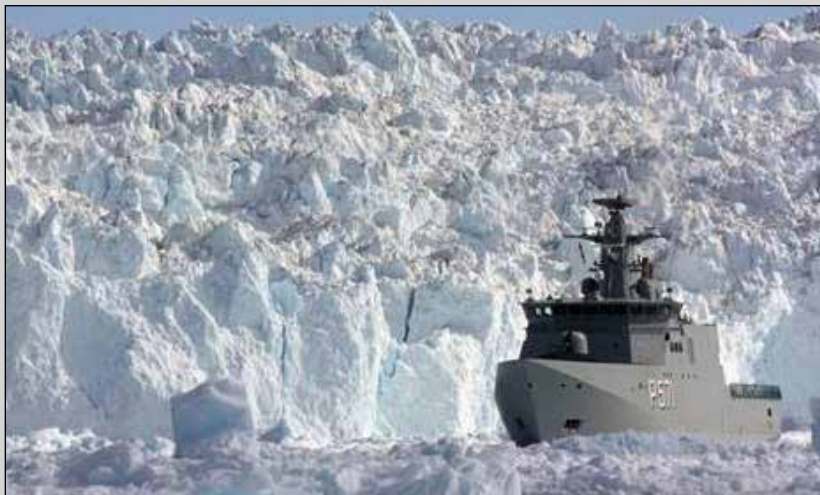
Søværnet på udkig efter et egnet isbjerg til at tage med til Rungsted Kyst.