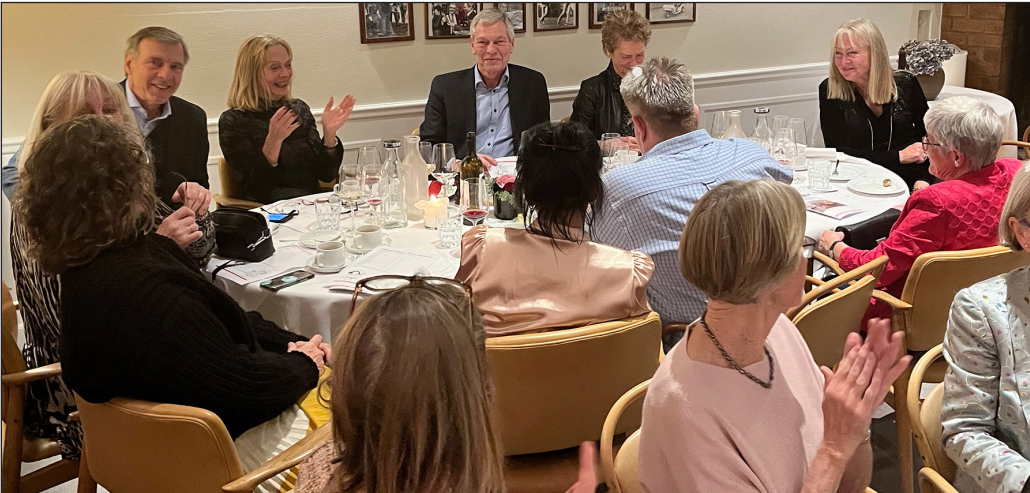
Vinderbordet 2022: De ni havde flest rigtige; nemlig 13 af 20 spørgsmål i quizen.