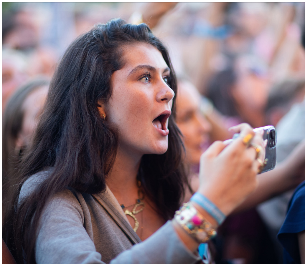
Begejstring over Ankerstjernes optræden lørdag aften på Rungsted Havnefestival.