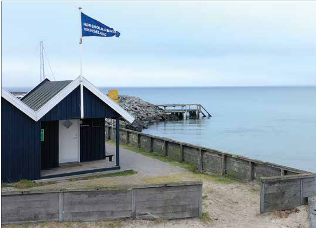
Vinterpaladset og Laugets badebro risikerer at blive eksproprieret - men foreløbig er den politiske afgørelse udsat til den nye kommunalbestyrelse 1. januar.