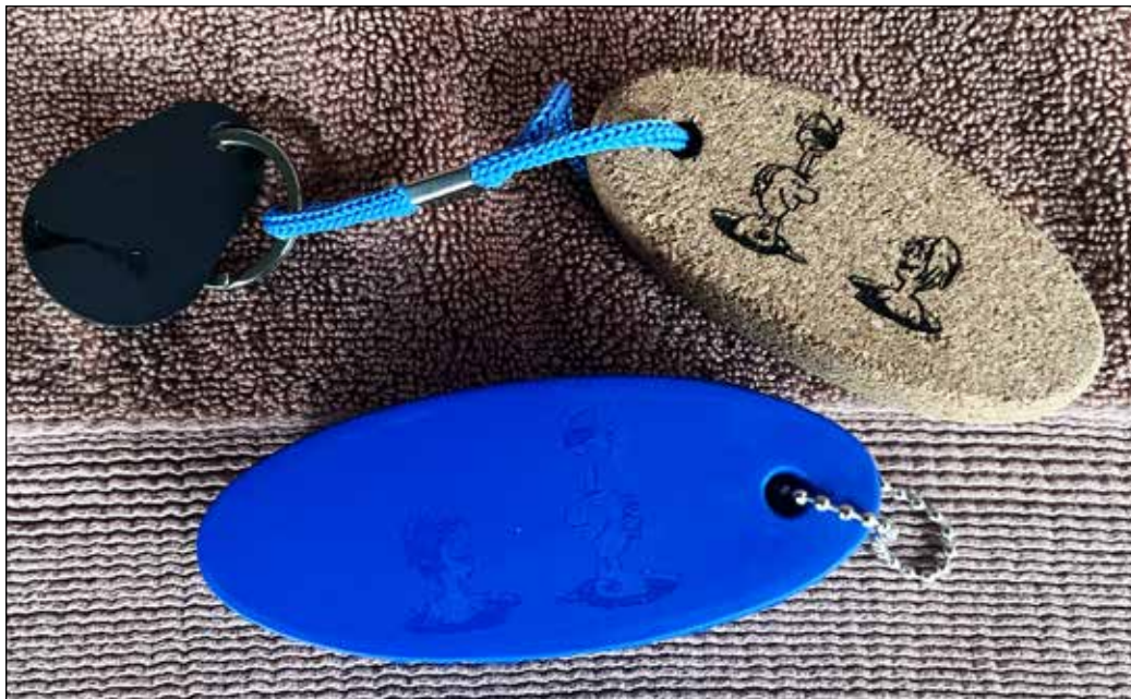
Laugets Titanic-nøglering har hidtil været i et farverigt skummateriale. Nu kommer der en ny udgave i kork, som ses øverst til højre i billedet.