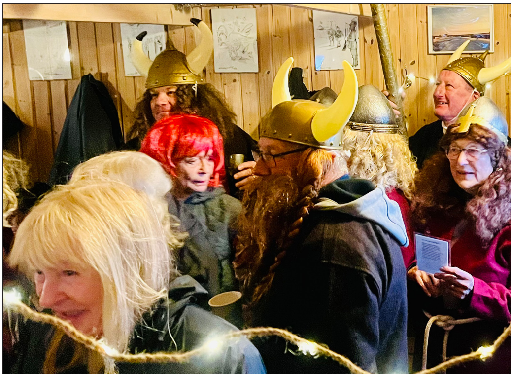
Der kan sagtens være 80 mennesker, truthorn, Lurendrejere, sanghæfter, morgenbrød og kaffekander i Vinterpaladsets 36 m 2 . Og gulvet holdt!